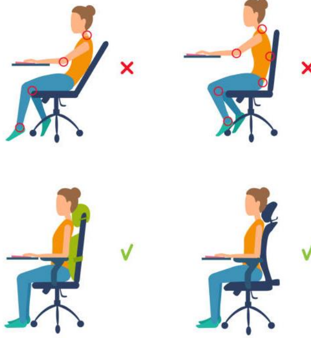
Resim 3: Sandalye kullanımı şematik gösterimi